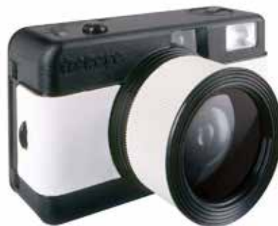
Fisheye Compact Camera