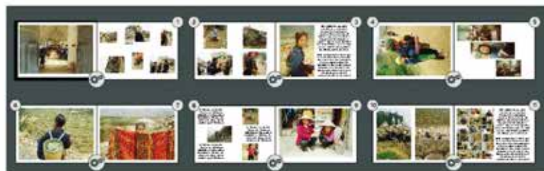
Chemin de fer, mise en page de l'ensemble de vos photos modifiables très facilement