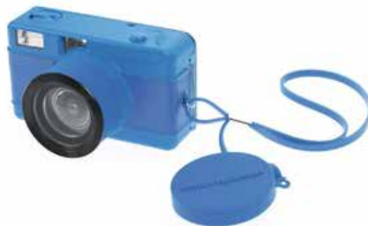
Fisheye Blue Camera