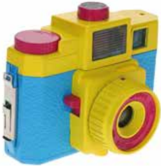
Holga Bunt Multicolor