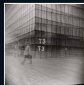
▲ Art Colektor