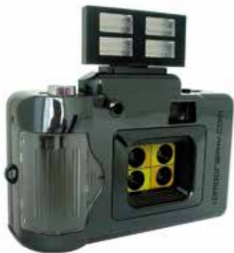
Action Sampler with Flash