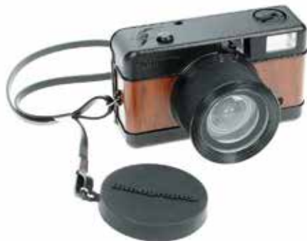
Fisheye Wood Camera