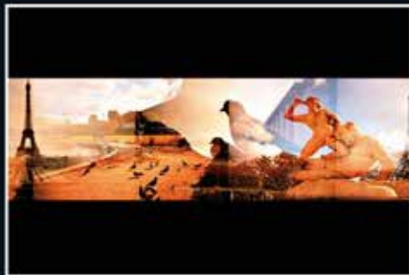
▲ Melanie Skriabine