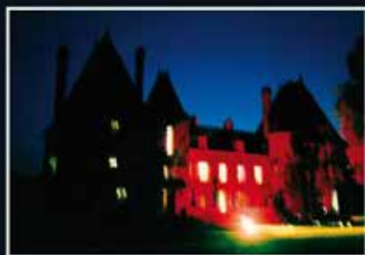
▲ Bertrand Corbara