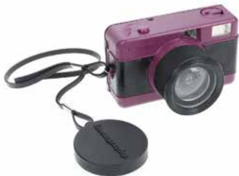
Fisheye Black Purple Camera