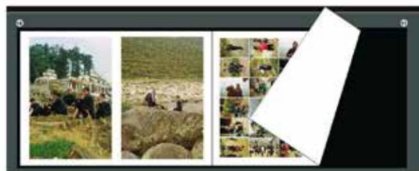
Prévisualisation de votre livre photo

Livraison chez Négatif Plus, retrait gratuit aux horaires d'ouverture. En colissimo suivi, forfait 5,90 € par envoi.