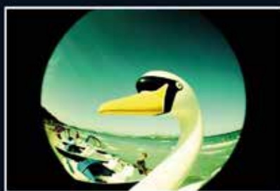
▲ Cyril Saulnier