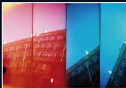
▲ Vincent Leyour