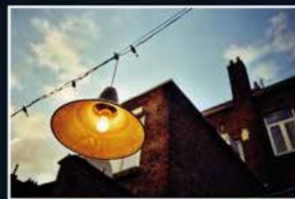
▲ Laurent Debuchy