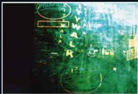
▲ Clarisse Merigeot