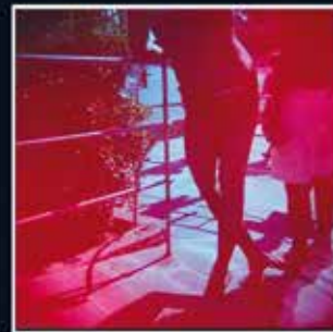
▲ Mat Beudet