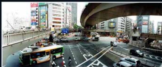
▲ Arnaud Malon